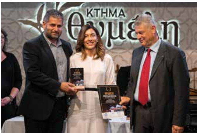
11. Πρότυπη διαχείριση τουρισμού: Κόκκινου Γαρυφαλήιά -THINK VILLA