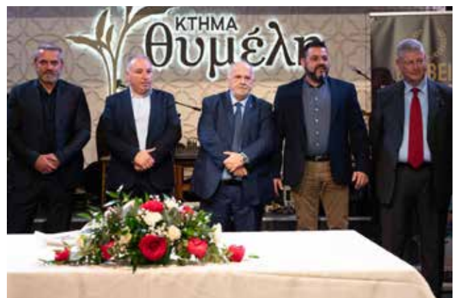
14. Επιτροπή βραβεύσεων